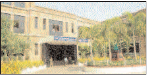
వర్షిటీని ప్రగతి పథంలో నడుస్తూ ముందుకు సాగుతున్నారు.

సువర్ణాధ్యాయం ఆచార్య సి ఆర్ రావు ఏయూ పూర్వ విద్యార్థి. ప్రారంభమైంది. వి ఎ ఆర్ వ రి స్థి తు ల్లో